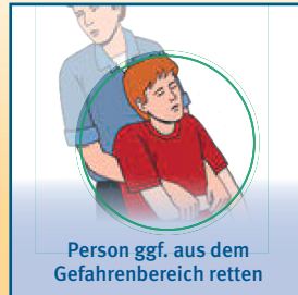
Person ggf. aus dem Gefahrenbereich retten