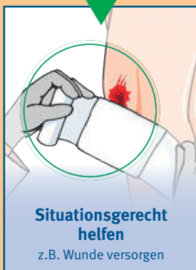
Situationsgerecht helfen z.B. Wunde versorgen