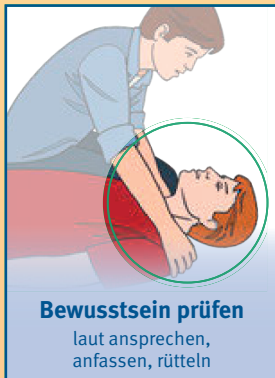
Bewusstsein prüfen laut ansprechen, anfassen, rütteln